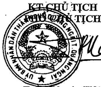
Trần Phước Hải